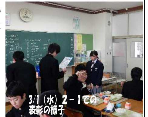
3/1(水) 2-1での表彰の様子