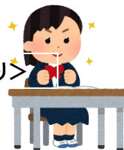
<事後のアンケート:自由記述より>

3人の先輩方とも、たとえどんな形であろうと最終的に自分の好きなこと、やりたいことの職業で働いていて、すごいと思いました。 私も先輩にならって自分の夢に向かって努力していきたいと思いました。