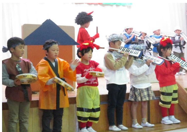
<みなみっ子発表会>