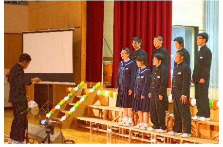
3年生「Y E L L」

○ダンス発表：9グループが出場しました。どのグループも完成度が高く、迫力がありました。 最優秀賞は3年生のお猿と愉快的仲間たち、優秀賞は2年女子のK・I・Aでした。