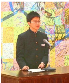
3年 男子 「都路を元気に するために」