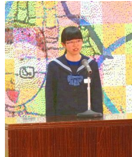
2年 女子 「The Last Leaf」