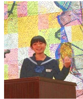
3年 女子 「Lime Light」