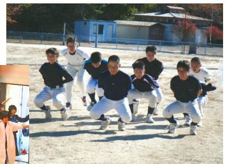
3年「ネバギバ ～へっぽこ9人と 1匹のボウズ～」