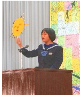
1年 女子 「The wind and sun」