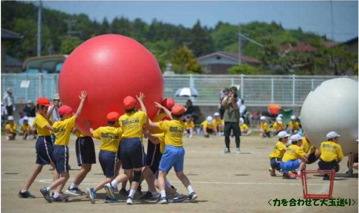
〈力を合わせて大玉送り〉