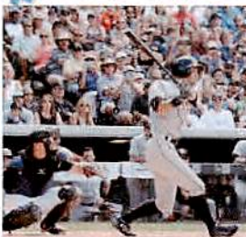
『マーリンズのイチロー外野手(42)』

2016.8.8、ロッキーズ戦に「6番・センター」で先発出場し、7回の第4打席、右超え三塁打を放つ