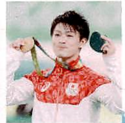
個人総合金メダルの内村航平選手