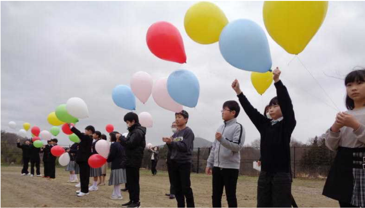
ありがとう、芦沢小学校～バルーンリリース～（令和5年3月25日）

芦沢小学校は、149年の輝かしい歴史と伝統に終止符を打ち、閉校となりますが、私たちの心の中の芦沢小学校は永久に不滅です。たくさんの思い出や勇気、自信など、芦沢小学校での学びは、バルーンに託して雲の上に保存しました。必要なときには、いつでも開くことができます。児童の皆さんは、4月から学びの場所は変わりますが、芦沢小学校での学びを誇りに思い、原点として自分の夢や目標の実現に向けてあしっ子魂を発揮してほしいと思います。地域の皆様、保護者の皆様、関係の皆様、本日まで芦沢小学校を支えてくださりまして本当にありがとうございました。