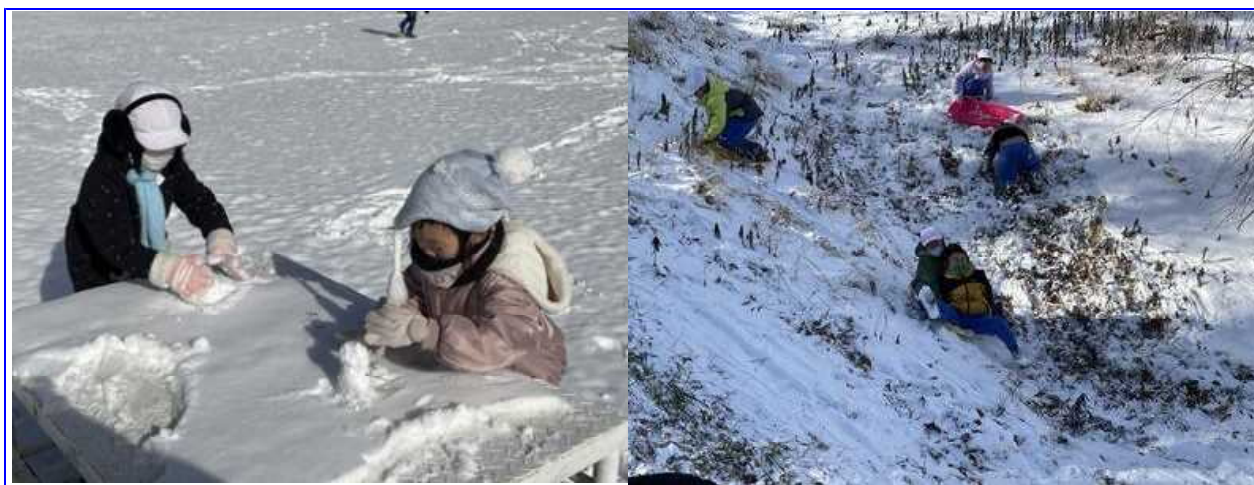
雪の日～元気なあしっ子～

新年、明けましておめでとうございます。今年もよろしく申し上げます。 今年卯年です。芦沢小学校の子どもたちにとって飛躍の年になればと思っております。4月からは船引南小学校と統合になりますので、子どもたちにとって自分を一段と飛躍させるチャンスでもあります。新しい出会いや経験をとおして、より多くのことを学び、成長できることを願っております。 保護者の皆様や地域の皆様には変わらぬご支援とご協力を賜りますようお願いいたします。