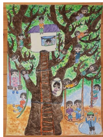
（あんりさんの作品）

集会では、改めて全校生の前に出ると緊張してしまっていました。年度末に向け、落ち着いてきちんとした態度で臨めるよう指導していきます。