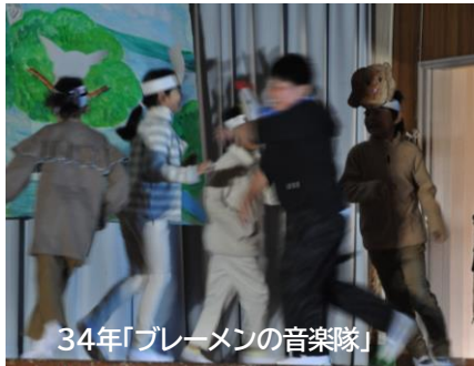
34年「ブレーメンの音楽隊」