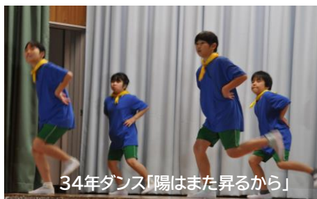
34年ダンス「陽はまた昇るから」