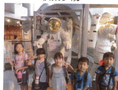
スペースパーク 1・2年