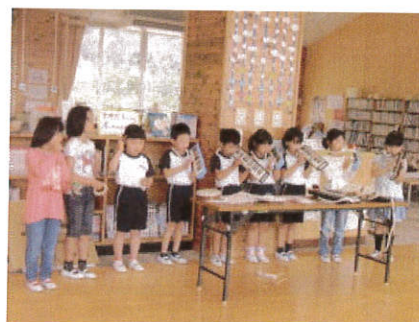
2学年発表全校集会