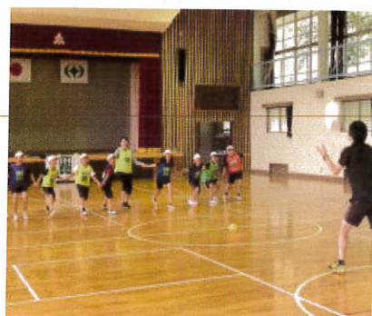
スポーツ笑顔の教室 5年