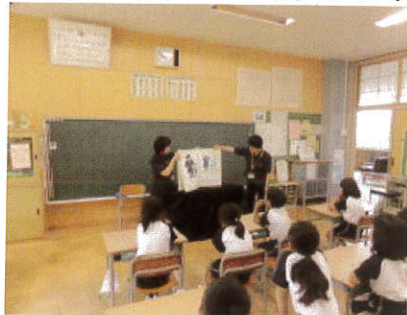
学校支援お話し会