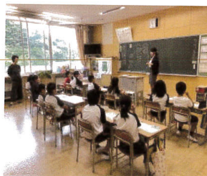
スポーツ笑顔の教室 5年