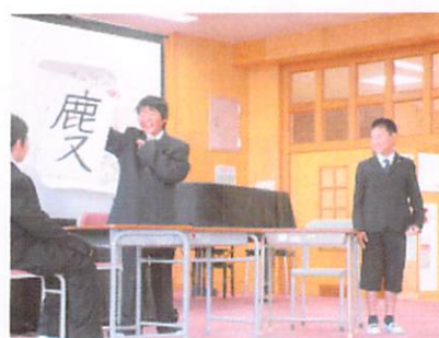
4年 「ピンク」「みどり」「あお」が いっぱいすてきなたむら