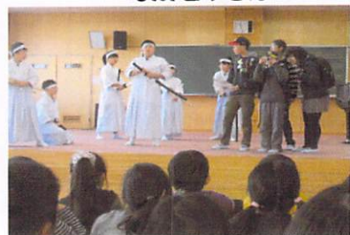
6年 私たちの修学旅行