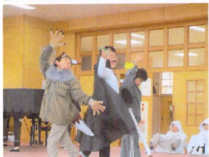
3年 ヒュードロンお化け学校