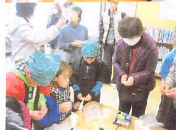
1・2年 みんなわくわく おみせやさん