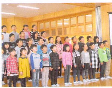
全校発表「群読・合唱」 「お祭り・竹取物語」 「世界が一つになるまで」