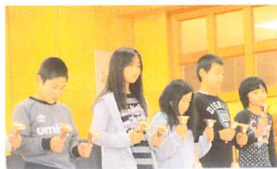
5年 ハッピータムタムテレビ