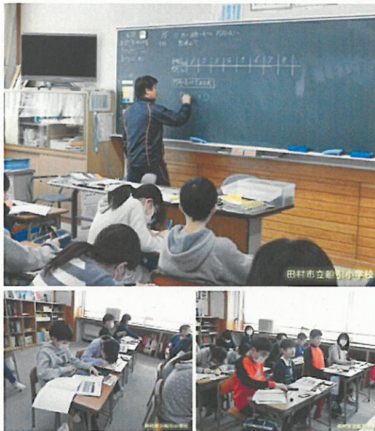
18:10 | 5 学年の様子

円の直径が変わると、円周がどのように変わるか調べていました。直径と円周を表にまとめていくと、その関係が見えてきました。直径が2倍、3倍・・・になると、円周も。この続きは、子どもたちへ聞いてください。