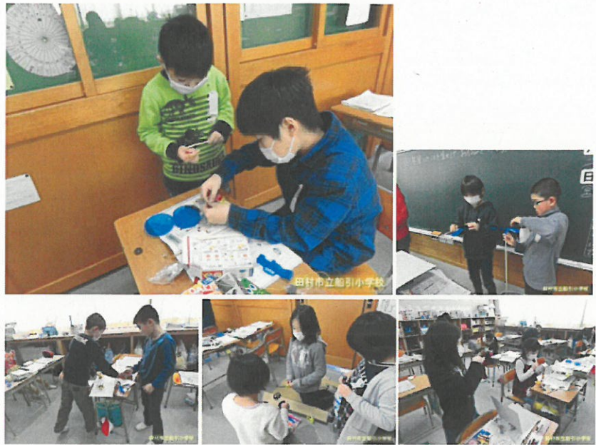
18:12 | 3 学年の様子