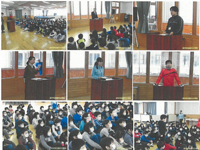
14:05 | 特設活動の様子

今日の昼休みに3年生への特設活動説明会が行われました。 船引小学校の特設活動は、陸上部、合唱部、合奏部、水泳部の4つです。 それぞれの担当から活動内容等について説明がありました。 説明を聞く3年生の表情は、本当に真剣でした。 来週、申込用紙を配りますので、たくさんの3年生が入部してくれるのを楽しみに待っています。