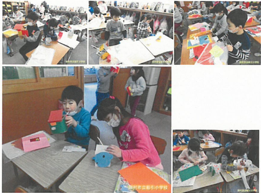
15:58 | 1学年の様子