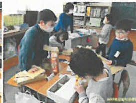
19:44 | 4 学年の様子