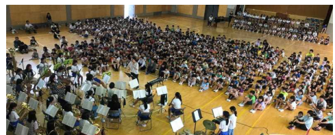
昨年度大会前、全校生への発表の様子

郡山市での合唱練習によるクラスター発生は衝撃的でした。“感染対策を徹底していたにもかかわらず…”です。このため、8月30日(日)に出場予定であった県合唱コンクールは、保護者の皆様の意向も確認した結果、出場を断念しました。これまで、出場に向けて練習を重ねていた子どもたちにはかわいそうですが、健康第一でやむを得ません。飛沫感染が懸念されることから、合奏部も併せて当面活動を休止することにしました。今後の状況にもよりますが、年度内に発表の場を設けることを検討しています。一方、陸上部は外での活動であることから、大会開催者の感染予防対策を確認した上で、参加を検討していきます。