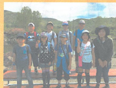
5年 男の子と女の子どっちが 勝つかな!