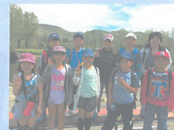
4年 竜宮城で魚たちが おもてなし