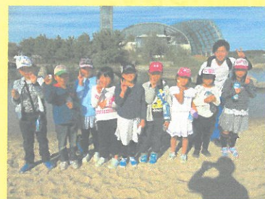
3年 Let's dance~.