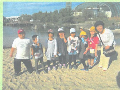
1年 悪いおじいさんも出るよ