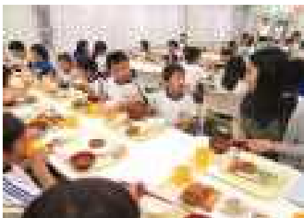
【セルフ方式「いただきまーす」】