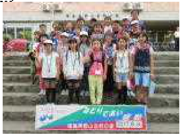
【自然の家玄関前で記念撮影】