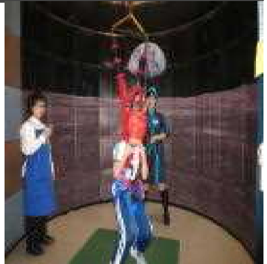
【宇宙飛行士になって 「月面ジャンプ！」】 於：郡山市ふれあい科学館

2日目は、 frisbeeゴルフ、プラ板キーホルダー作り、屋内スポーツ（ドッジビー）と盛りだくさんのプログラムでした。2日間通して雨に降られず、野外で思い切り体を動かし自然を満喫することもできました。来年もまた、3年後に常葉中学校に進学する同学年の子ども達が、密度の濃い1泊2日の交流を通して互いを知り仲良くなり、社会性等が育まれたことも大きな成果でした。保護者の皆様には、宿泊学習の準備や事前の健康面への配慮等、ありがとうございました。