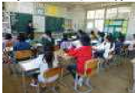
【4年国語「詩を楽しもう」】