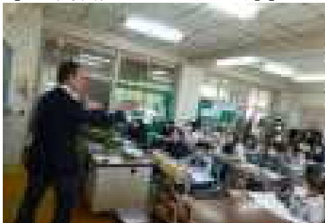
【5年社会「わたしたちの国土」】