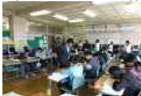
【6年家庭「私の仕事と生活時間」】

4月14日(金)今年度第1回の授業参観を開催いたしました。お忙しい中、保護者の皆様には多数ご参加くださりまして、ありがとうございます。