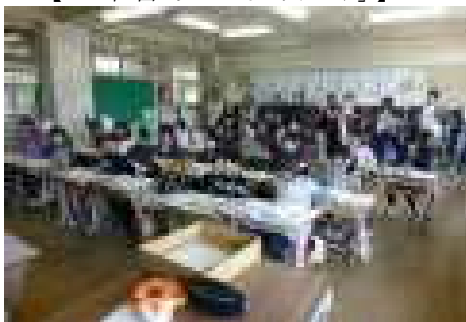
【3年算数「九九を見なおそう」】