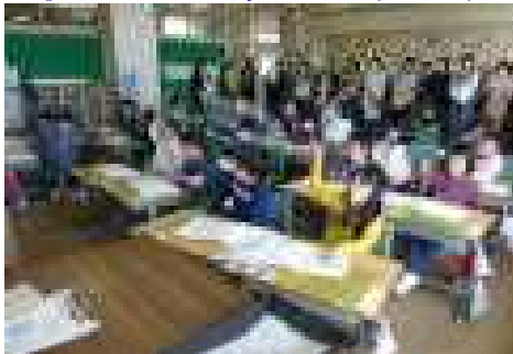
【1年書写「ひらがなあつまれ」】