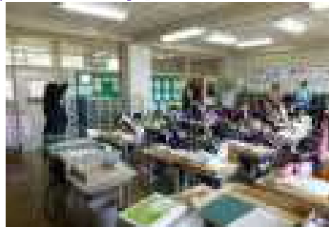
【2年国語「ふきのとう」】