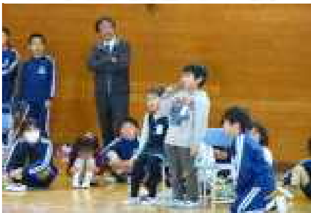
【1年生、一人ひとり自己紹介】