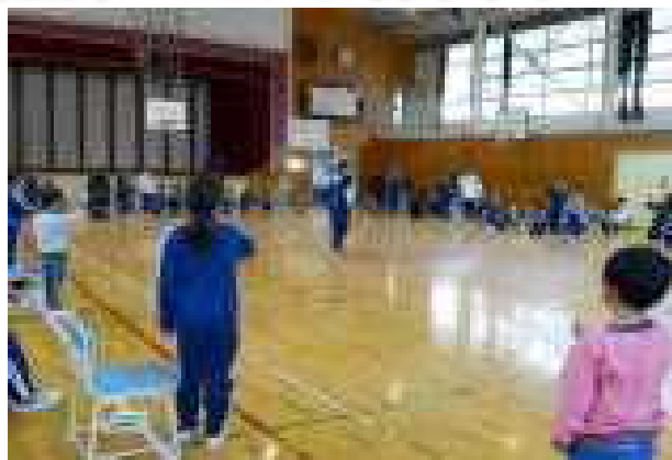
【先生方の顔と名前をおぼえました】