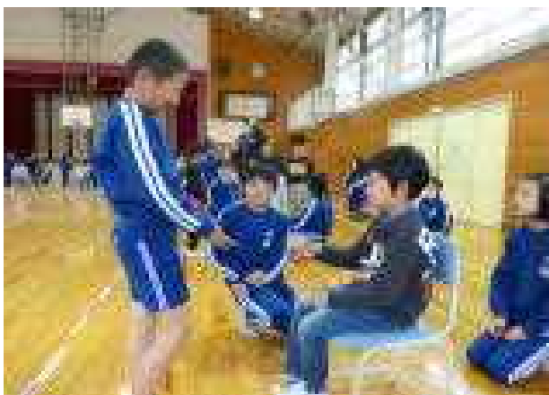
【「ジャンケンポン、アイコデショ」】