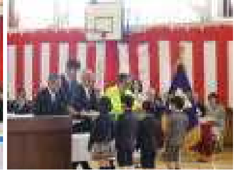
【祝品授与、田村市・PTA・同窓会・交通安全協会より】