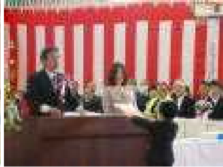
【教科書給与、「しっかり勉強しましょう」】