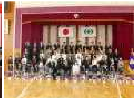
【新入生と一緒に記念撮影】