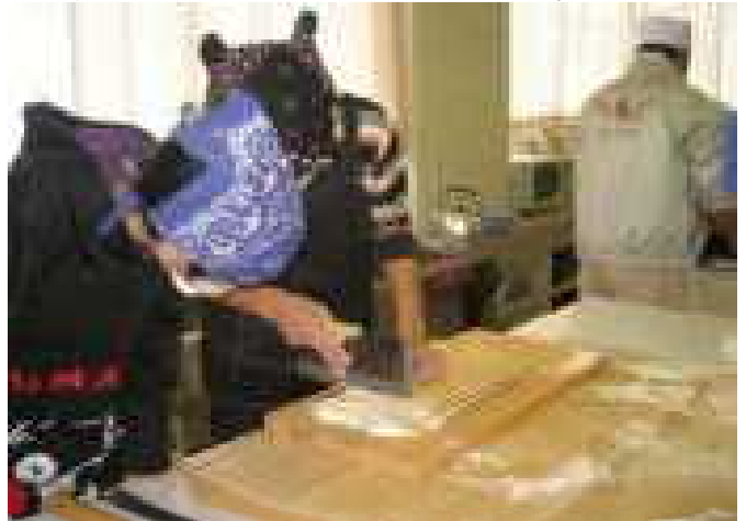
【麺切り包丁で2mmの幅に切ります】