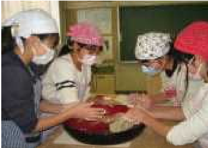
【そば粉をこねて大きな団子にします】

蕎麦は「三たて」といって、「挽きたて」、「打ちたて」、「茹でたて」が美味しく食べる条件だそうです。日本の食文化の価値を知り、子ども達に継承していただきたいです。