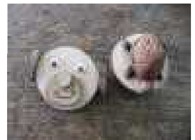
2年「かめ、動物の顔ストラップ」