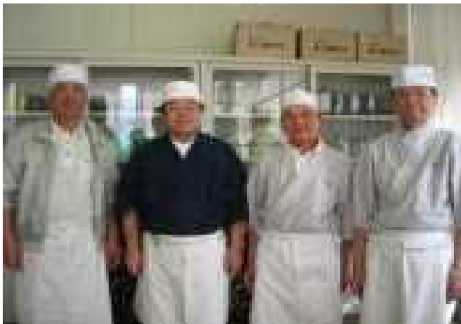
【蕎麦打ちときわ会の皆様】