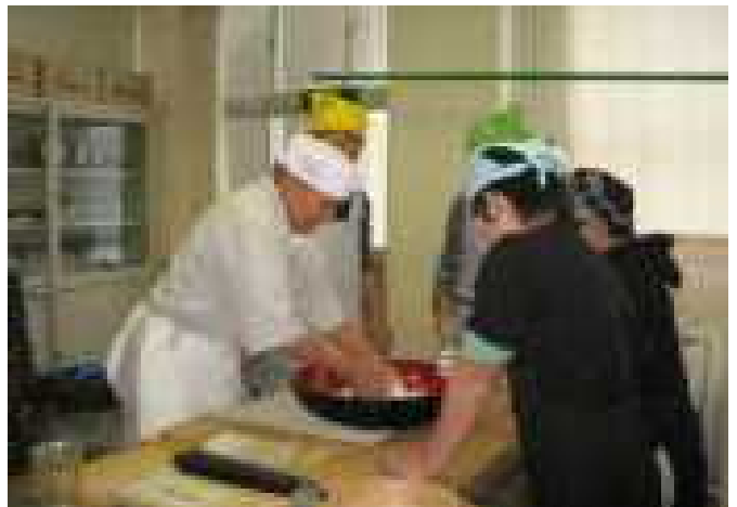
【講師の先生の技をじっと注目！】