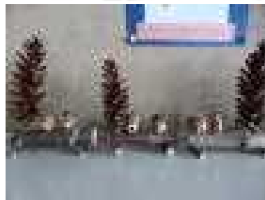
1年「どんぐり・まつぼっくりのおきもの」