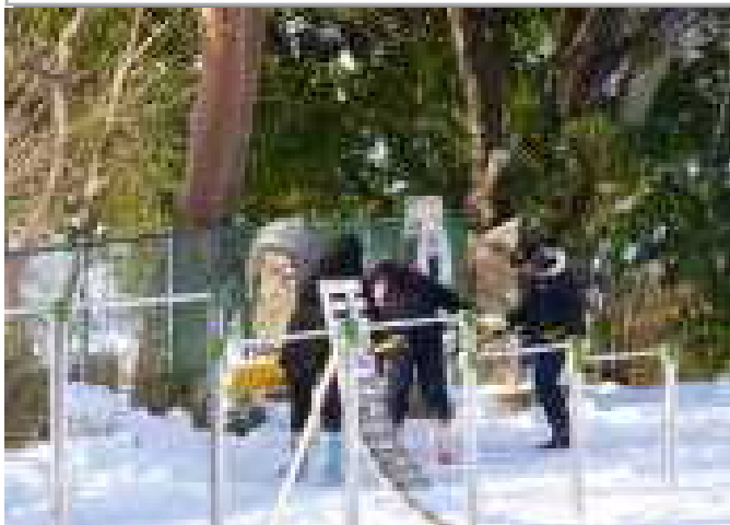
【環境委員会児童、雪かき作業】