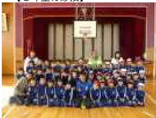
【1・2年 講師と集合写真】