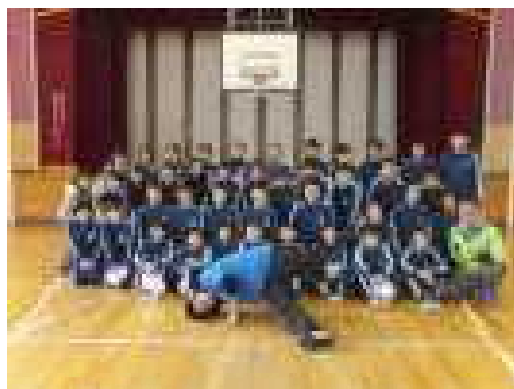
【5・6年 講師と集合写真】