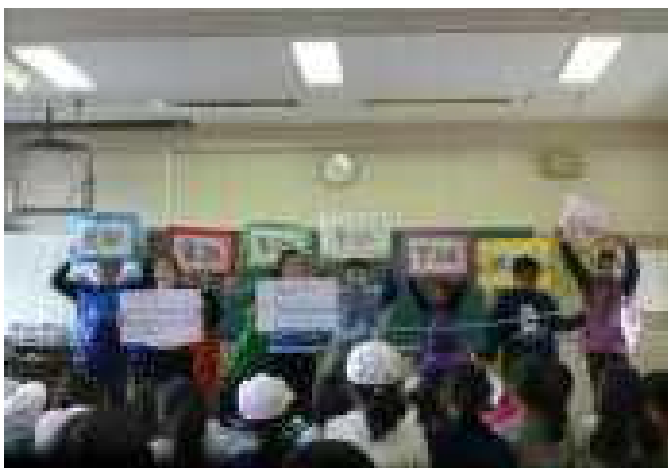
【カゼ予防劇上演：保健給食委員会児童のすばらしい演技、熱心に鑑賞する子ども達】

お茶うがいが始まりました。 持ち帰った水筒はきちんと 洗うようお願いいたします。