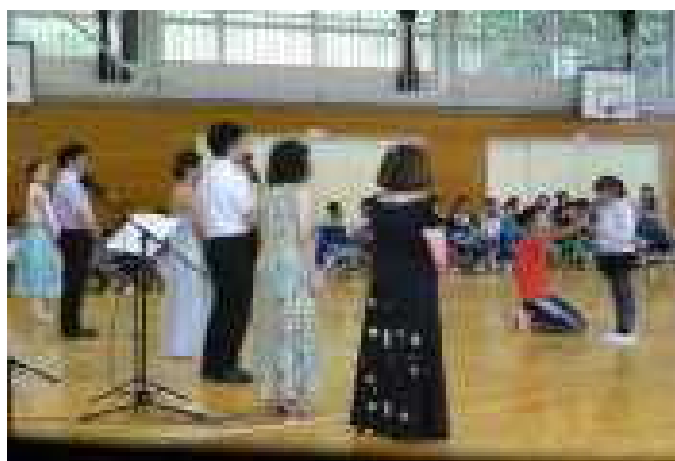
【アンコールの後、お礼の言葉】