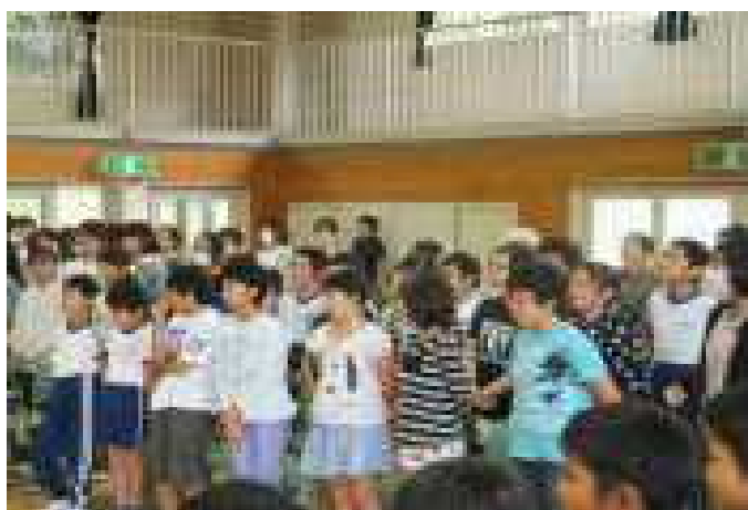
【みんなで考えよう音楽クイズ】