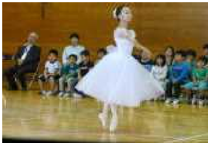
【「ひとつの地球」の曲でバレエ】