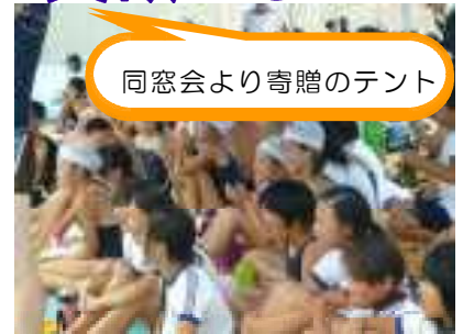
同窓会より寄贈のテント

惜しくもリレー1位は逃しましたが6年生を中心に入賞者はのべ59名に達しました。また自己新記録を更新した児童も多く、よく頑張ったと思います。保護者の皆様には応援、ありがとうございました。