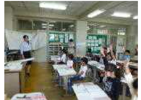
【 2年国語「お手紙」 】 【 5年図工「心のもよう」 】 【 3年国語「こまを楽しむ」 】