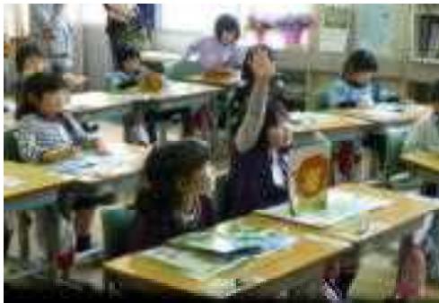
【第1学年 国語科（書写）】

左写真は、1年書写「文字の世界へ出かけよう」の授業です。正しい姿勢や鉛筆の持ち方を学習しました。