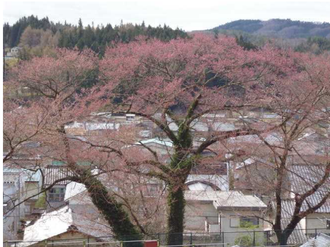
【つぼみが膨らんできたソメイヨシノ 4/15】