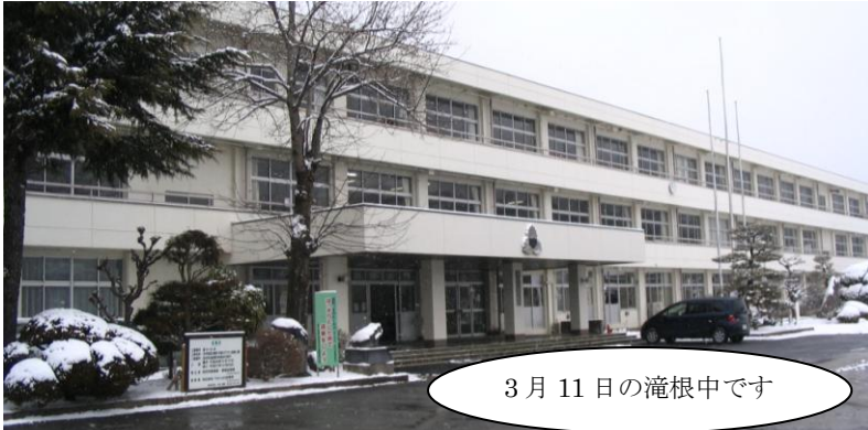
3月11日の滝根中です