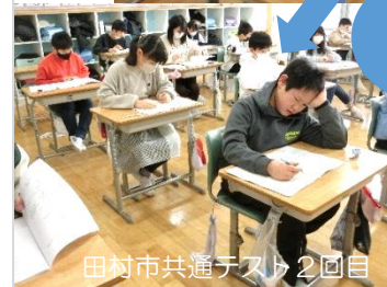
田村市共通テスト2回目