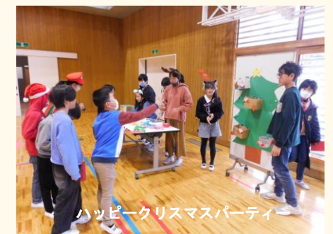
ハッピークリスマスパーティ