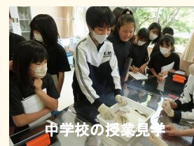
中学校の授業見学