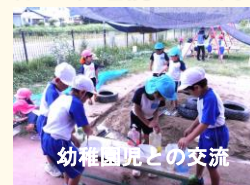
幼稚園児との交流