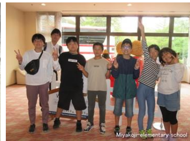
9月24日25日 6年修学旅行から（下郷、会津若松、北塩原村へ）