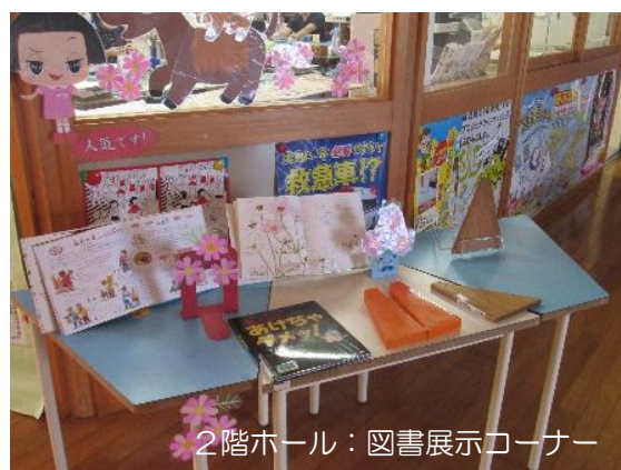
2階ホール：図書展示コーナー