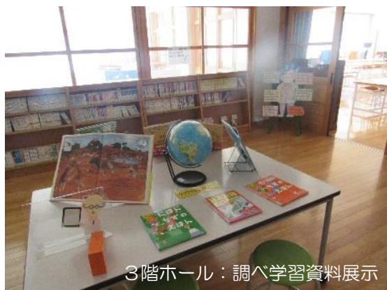
3階ホール：調べ学習資料展示

これからも図書館担当の先生二人を中心にしながら、子どもに多くの良書に出会わせ、読書の好きな都路っ子を育てていきます。ご家庭でも、子どもたちに心の栄養をぜひお願いします！