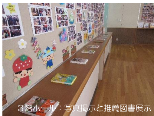
3階ホール：写真掲示と推薦図書展示