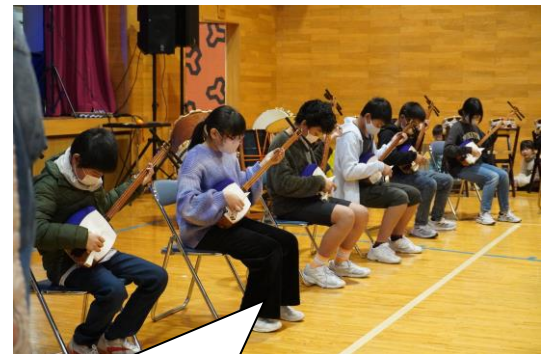
三味線の演奏を体験しました