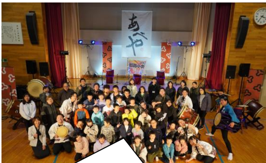
出演者のみなさんと記念写真を撮りました

舞台芸術を観たりすることができました。本物に触れる機会は、大変貴重な体験となって、子ども達の心に残ったようです。子ども達が本物に触れる機会を、これからも大切にしていきたいと思います。