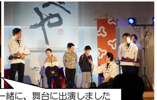
一緒に、舞台に出演しました

12月11日(水)本校で、舞台芸術和楽器公演が行われました。間近で、プロの方の和楽器の演奏や民謡を聴いたり、ししまいなどの