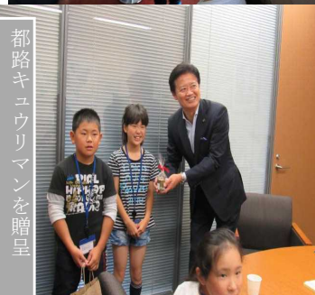
都路キュウリマンを贈呈