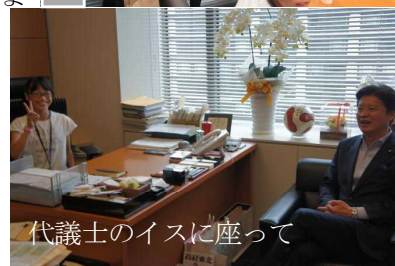
代議士のイスに座って