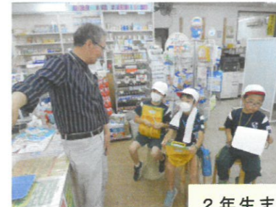
2年生まちたんけん