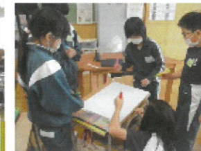
3校合同の交流学习

令和5年度の統合に向けて、全学年の交流学习を進めています。授業や様々な教育活動を通して、交流を深めていきます。