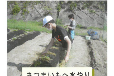
さつまいもへ水やり

地域で社会の基礎を学んだり、地域で栽培活動を体験したりと、地域が子どもたちにとって大切な学びのフィールドとなっています。ご協力頂いた地域の皆様、ありがとうございました。