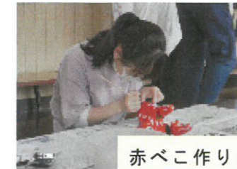
赤べこ作りと鶴ヶ城見学