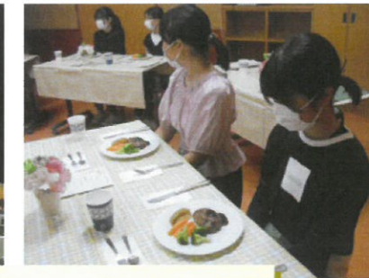
5・6年芸術鑑賞と6年テーブルマナー教室